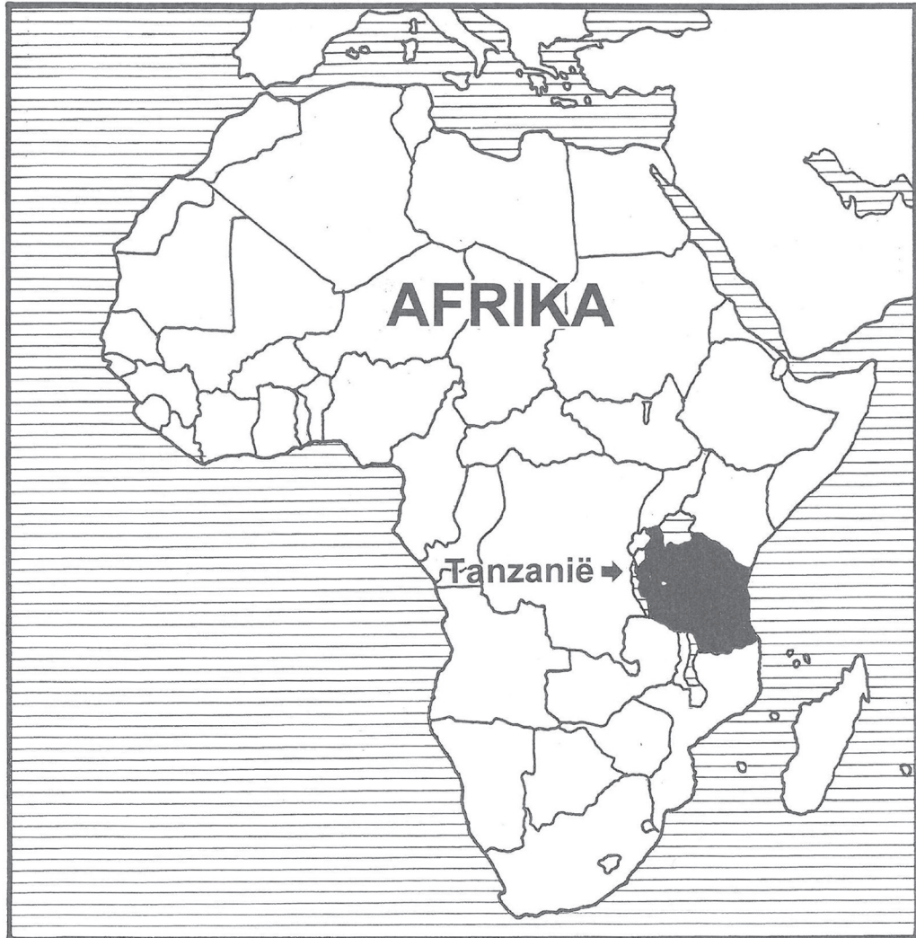
Tanzanië in Afrika

Kyk na die kaarte hieronder: jy sal plekke in die verhaal hier raaklees.