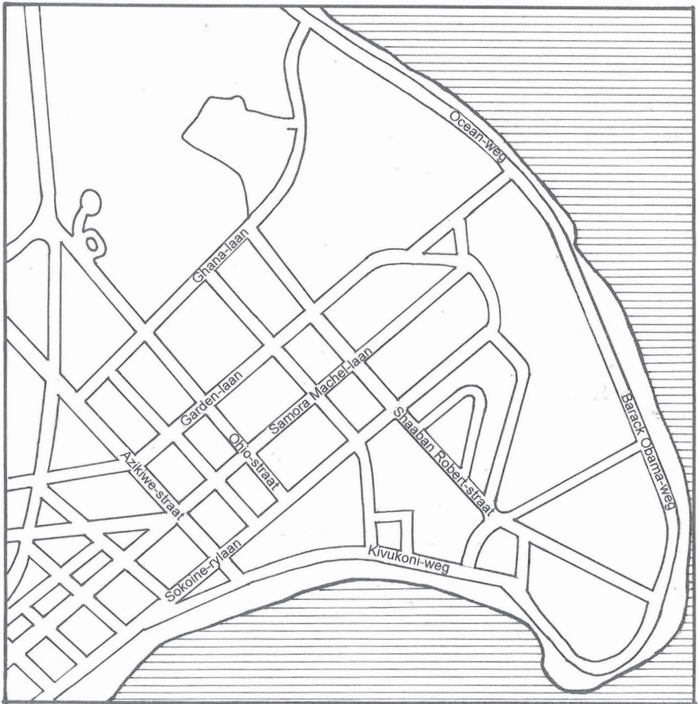
Straatkaart van Dar es Salaam