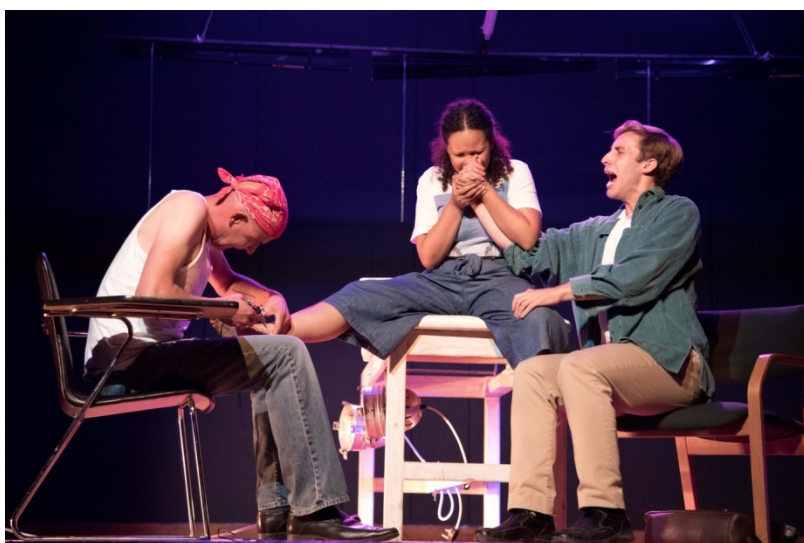
Foto: Nicola kry 'n skoelapper-tatoeëermerk

Nicola leef in haar suster se skaduwee. Sy weet dat haar ouers nie sal toelaat dat sy 'n tatoeëermerk kry nie, maar sy rebelleer en doen dit in elk geval. Die skoelapper-tatoeëermerk laat haar vry voel. Sy hou nie van duur geskenke nie. Sy erken teenoor Dewald dat sy homoseksueel (gay) is en dat sy 'n vriendin, Yolandi, op Facebook ontmoet het wat haar gelukkig maak. Sy steek dit vir haar ouers weg, omdat sy bang is dat hulle haar sal oordeel.