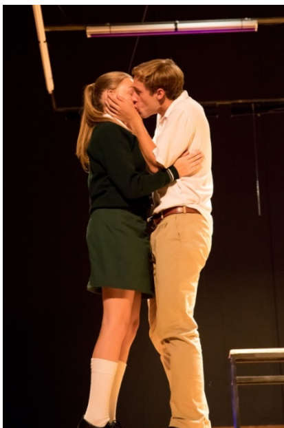
Foto: Dewald soen vir Karlien

Wanneer hy uitvind waarom Nicola selfdood gepleeg het, vertel hy nie die volle waarheid aan haar ouers nie. Hy bly lojaal aan haar, want hy weet haar ouers sou nie haar homoseksualiteit goedkeur nie. Dewald is baie impulsief , hy raak verlief op Karlien en soen haar op die skoolterrein al weet hy dit is teen die skool se reëls.