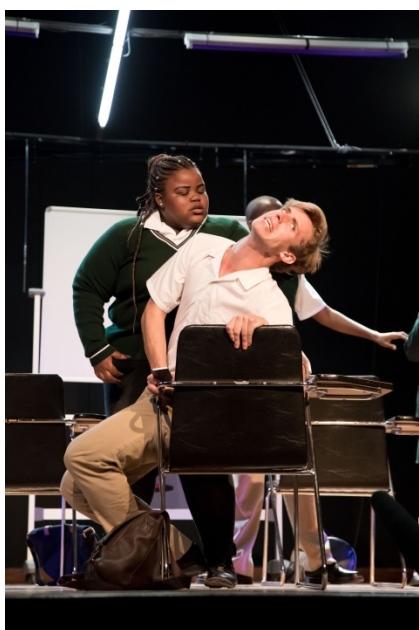
Foto: Aldi probeer vir Dewald intimideer

Aldi Lotter is 'n lywige graadelf-meisie en die skool se boelie. Sy knou almal by die skool af en die leerlinge doen alles wat sy vra omdat haar pa invloedryk is en baie mag het. Dewald laat egter nie toe dat sy hom intimideer nie en hy is nie bang vir haar nie. Toe hy 'n graadagt-meisie, Clarissa , uit Aldi se kloue red, is Aldi woedend. Sy sê vir Dewald dat sy sal sorg dat sy ouers hulle werk verloor en slaag ook daarin dat sy ma afgedank word. Sy veroorsaak dat Dewald baie seer kry wanneer hy ongenooid by haar huis aankom met die doel om vrede te maak. Sy skrik baie groot en vrees dat hy sal doodgaan, daarom dra sy hom hospitaal toe en verdwyn daarna spoorloos.